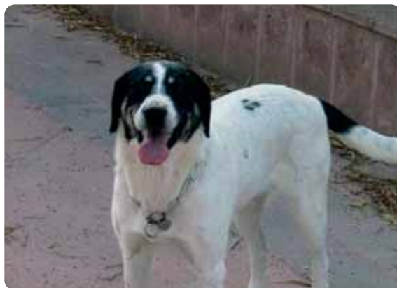
Figura 7 - Coda tenuta sotto la linea del dorso indica sottomissione.

Non si conosce ancora perfettamente il significato di questo segnale: è un comportamento complesso che riguarda sia la comunicazione olfattiva (agitando la coda, si diffondono nell'ambiente le secrezioni odorose emesse dalle ghiandole presenti a livello di regione anale e perianale) che visiva (il movimento della coda).