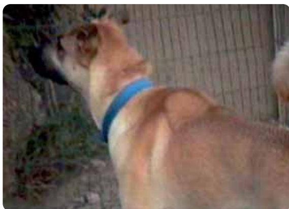
Figura 6 - Piloerezione nel cane (sollevamento del pelo in alcune parti della schiena).

Tutte queste posture sono transitorie e specifiche rispetto al contesto. Un cane può mostrare una postura agonistica e poi, in base alla risposta ricevuta dall'interlocutore, passare ad una postura di sottomissione e viceversa. Per questo motivo, se due cani sono liberi, normalmente è meglio non intervenire tra loro anche se notiamo atteggiamenti agonistici. Se invece i cani sono al guinzaglio e non possono essere lasciati liberi, la normale comunicazione può essere ostacolata e quindi in presenza di posture agonistiche è meglio evitare di farli fronteggiare direttamente (vedere il paragrafo 'Prevenire le liti tra cani').