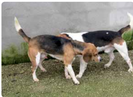
Figura 1 - Nel cane sono molto importanti i segnali olfattivi emessi da diverse ghiandole localizzate in varie parti del corpo.

Esistono anche dei segnali misti (olfattivi e visivi) quali urinare con la zampa sollevata (Fig. 2), marcare con le feci, raspare il terreno con rilascio delle secre-