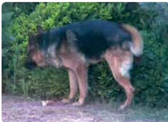
Figura 2 - Urinare con la zampa sollevata costituisce sia un segnale visivo che olfattivo.