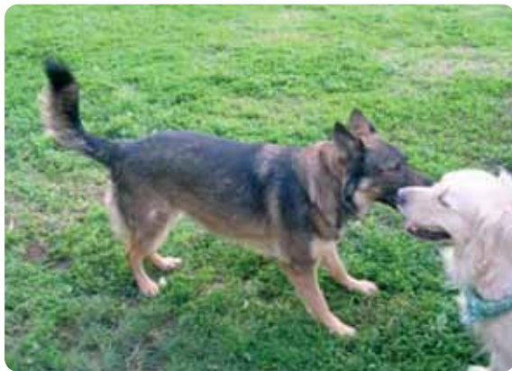
Figura 9 - Coda sopra la linea del dorso può indicare minaccia.

È importante ricordare che ci sono posizioni e tipi di portamento della coda che sono particolari di determinate razze e devono essere interpretate conoscendo bene l'aspetto normale della coda: per esempio i cani tipo spitz portano naturalmente la coda alta arrotolata sul dorso.