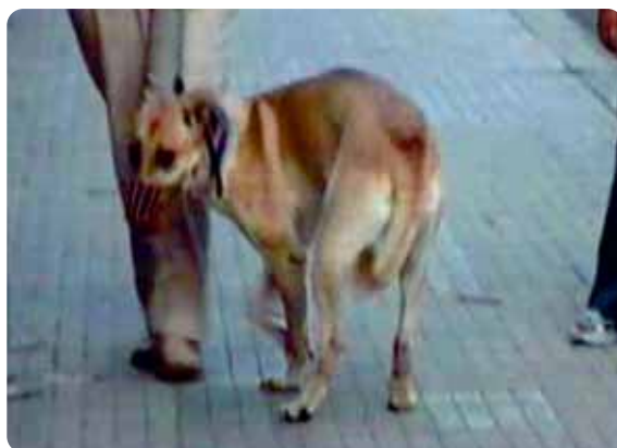
Figura 8 - Coda fra gli arti posteriori indica paura.