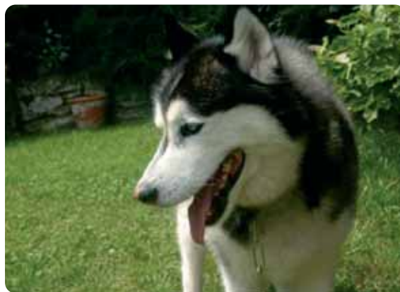
Figura 3 - Distogliere lo sguardo è un segnale che serve al cane per evitare di arrivare allo scontro fisico.

l'ultima possibilità. Alcune tra le posture che mirano ad evitare lo scontro sono: sembrare più piccoli, abbassare il collo e le orecchie, toccare con la zampa, leccare le labbra, distogliere lo sguardo (Fig. 3), esporre la regione inguinale (Fig. 4), scappare, acquattarsi, sedersi, mettersi in decubito laterale con un arto posteriore sollevato.