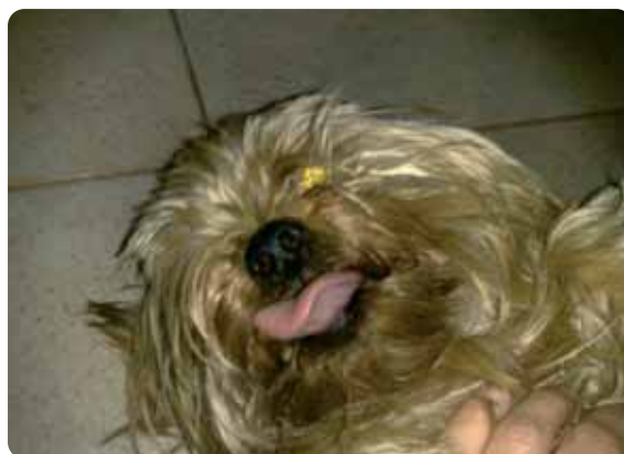
Figura 5 - Leccarsi le labbra può essere un segnale di stress e di paura.